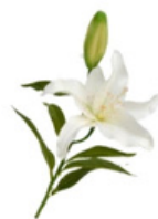
HUILE DE LYS UNIFIANTE CICACITRANTE