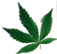
HUILE DE CHANVRE APAISANTE REGENERANTE