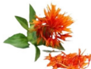
HUILE DE CARTHAME APAISANTE ROUGEURS