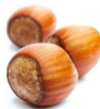
HUILE DE NOISETTE EQUILIBRANTE